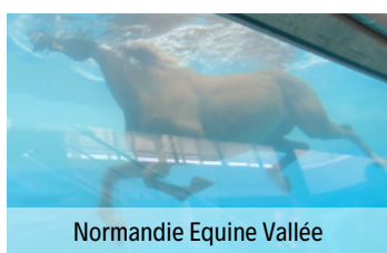
Normandie Equine Vallée