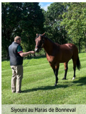
Siyouni au Haras de Bonneval