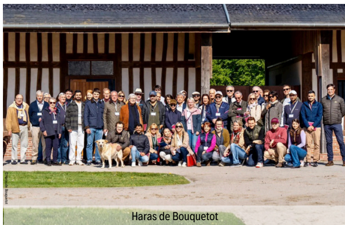
Haras de Bouquetot