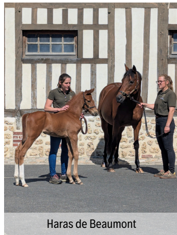
Haras de Beaumont