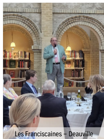
Les Franciscaines - Deauville