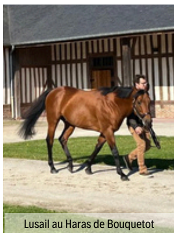
Lusail au Haras de Bouquetot