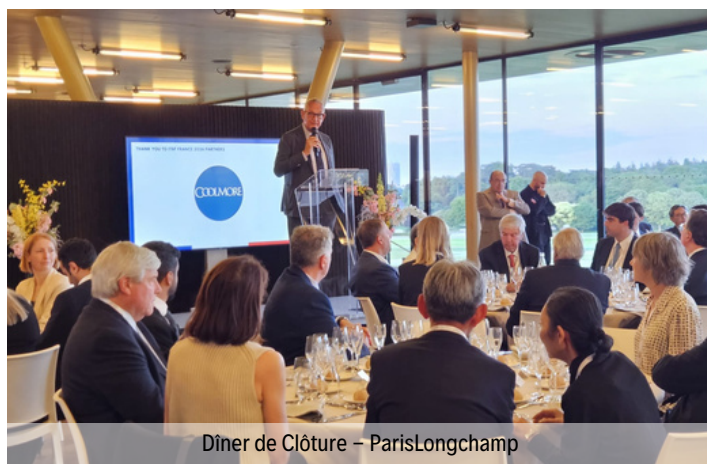
Dîner de Clôture - ParisLongchamp