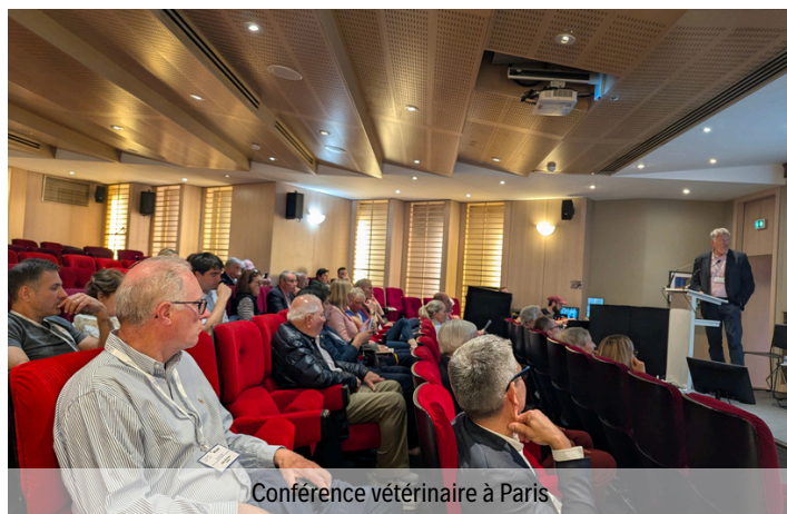
Conférence vétérinaire à Paris