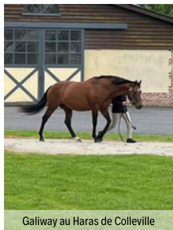
Galiway au Haras de Colleville