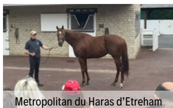
Metropolitan du Haras d'Etreham