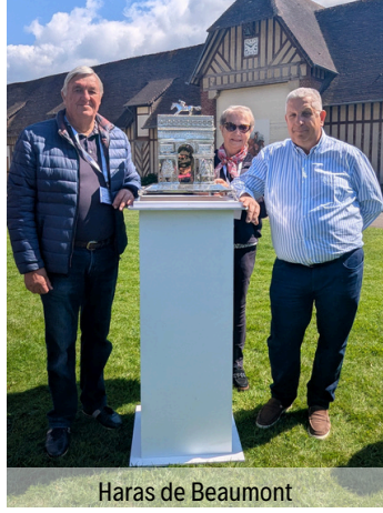
Haras de Beaumont