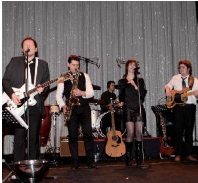
Le Groupe Tuxedo