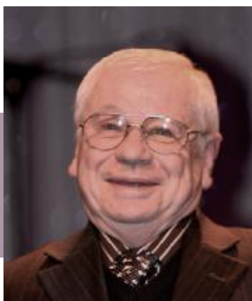
Gildas VAILLANT pour Princesse d'Anjou Grand Steeple Chase