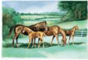
Syndicat des éleveurs