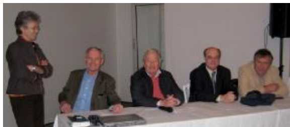
Les intervenants à la réunion sanitaire du 5 décembre.