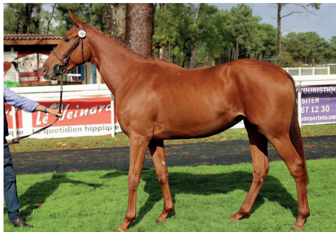
Happy Birthday, à 2 ans, au moment du Grand Show Anglo Course 2024