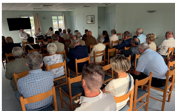
Une partie de l'assistance du moment d'échange FEG - ASSELCO

Classés en six thématiques, les intitulés de chaque thème permettaient de prendre le pouls et de classer par ordre d'importance les réalités et les préoccupations actuelles des éleveurs.