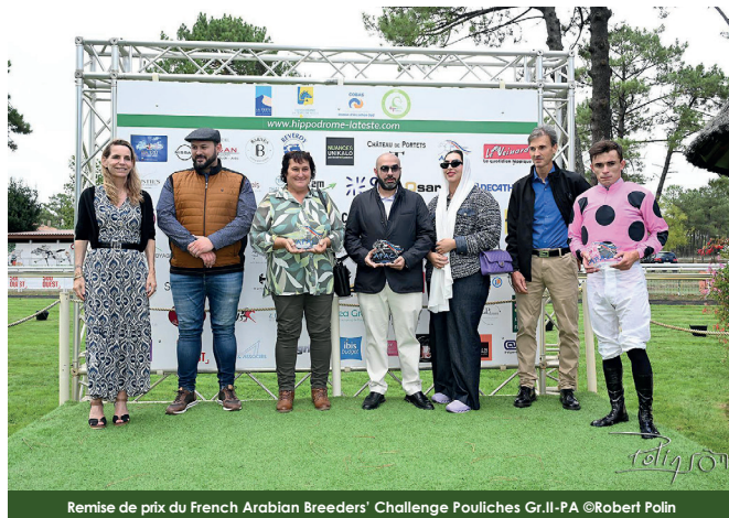
Remise de prix du French Arabian Breeders' Challenge Pouliches Gr.II-PA