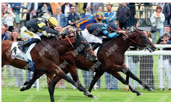
Woodshauna en tête du Prix Jean Prat, Gr.1